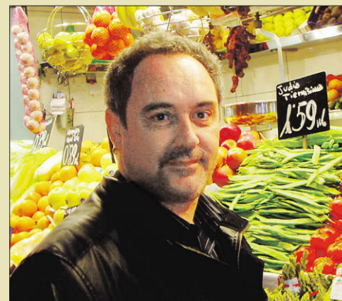
Ferran Adrià: „Nur wer isst, kann verstehen.“

Plötzlich ruft er zu einer Herrenrunde: „Ist alles in Ordnung, Ferran?“ Erstaunt blickt man auf und kann es kaum glauben: Ja. Hier sitzt Ferran Adrià,