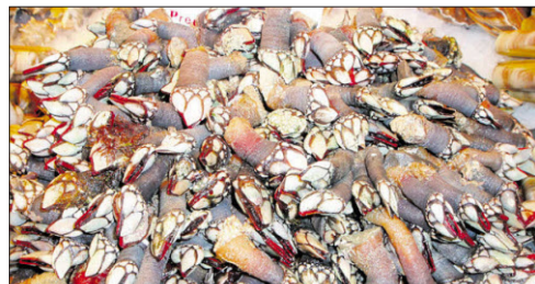
Frühlingsboten aus dem Meer: Percebe vivo.

Es gibt auch noch Sardellenfeste, Melonenfeste, Speiseölfeste und die badejada , das große Stockfischessen zum Jahresende. Die Katalanen genießen gerne, und das wollen sie zum Ausdruck bringen. Wie sonst wäre es möglich, dass es Märkte gibt wie La Boqueria ? Auch der routinierte und weit gereiste Marktbesucher wird kaum jemals einen gesehen