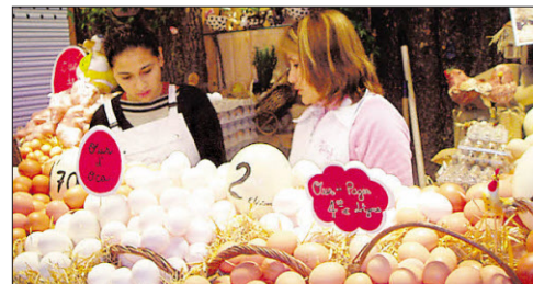
Ein Korb Eier sichert eine „sonnige Zukunft“.

La Boqueria befindet sich unter einer riesigen Eisenkonstruktion, die 1914 nach dem Vorbild der Pariser Hallen entstand. Hier wird das Drehbuch noch von den Jahreszeiten geschrieben. Man kann an den Ständen essen oder an einer der unzähligen Bars. Man kann Langusten, Fische und Muscheln kaufen – einzeln oder körbeweise. Man kann den Fischfrauen zusehen, wie sie gekonnt blaue Rochen zerlegen. Man hat an den Bacallaneries die salzige Qual der Wahl. Man kann würzige Marinaden frischer Anchovis kosten oder sich an zahlreichen Sorten Chorizos , Botifarras , Salchichóns und dem Schinken von schwarzfüßigen oder zartrosa Schweinen delectieren. Man kann aber auch die Eierstände bewundern, an denen junge Mädchen die Produkte von Hennen, Gänsen und Straußen verkaufen – und dabei wohl an