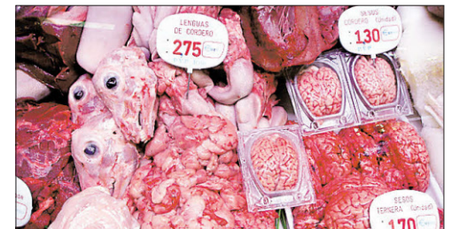
Gewöhnungsbedürftig: Schafsköpfe, Innereien.

An den Gemüseständen außerhalb der Halle liegen neben Kartoffeln und Zwiebeln auch Besonderheiten – streichholzdünner Spargel, saftige Tomatensorten, die man für